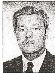
doc. J. Tekel'