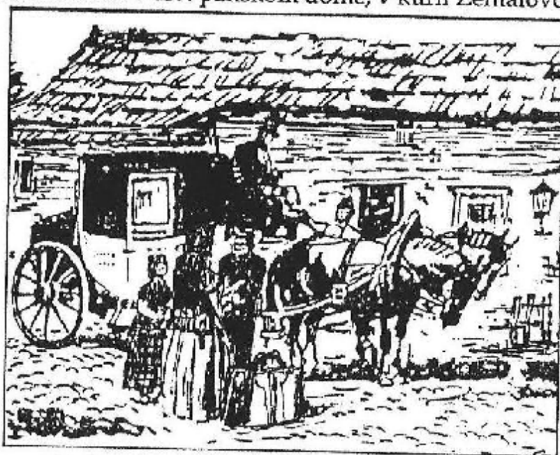
Dostavník pred domom Zentalovcov v Plevníku

Pošta v neďalekej obci Plevník - Drienové (6 km od Bytče) si 21.6. pripomenie 125. výročie zriadenia. Deň 21. jún 1886 patril v poštovníctve na Slovensku k významným, pretože v ten deň bolo zriadených 12 poštových úradov. Pre Bytču je okrajovo zaujímavý tým, že v ten deň bola pošta otvorená aj v Považskom Podhradí, kde mal sídlo barón Leopold Popper, majiteľ zámku v Bytči, s pôvodným administratívnym ústredím v Hliníku. Pošta v Plevníku sídlila v tzv. panskom dome, v kúrii Zentalovcov.