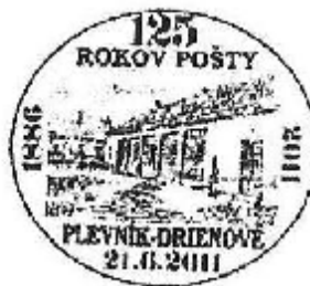
Dostavník pred kaplinkou v Plevníku. Príležitostná pečiatka