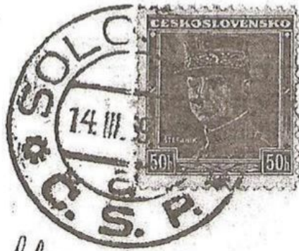
Výstrižok z pozdravu na pohľadnici s dátumom 14.3.1939