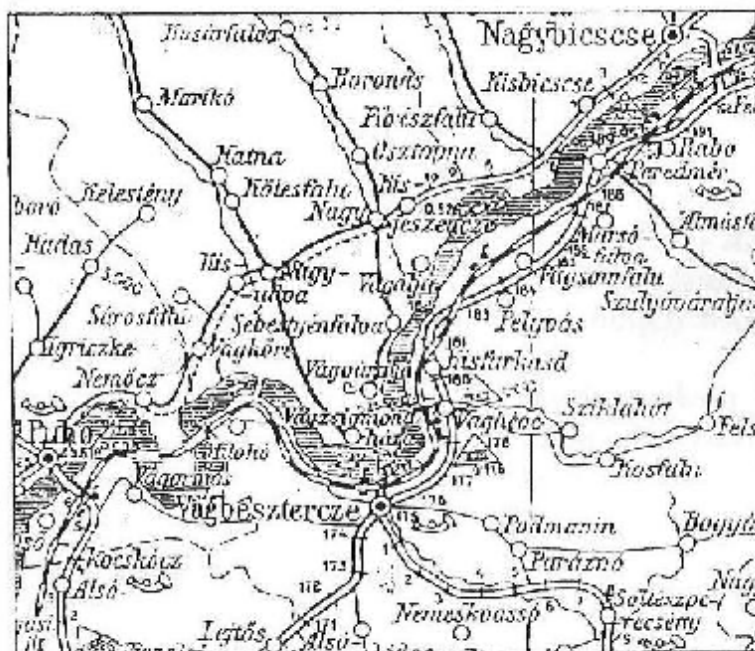
Mapka železnice z roku 1907

V roku 2008 si 120. výročie začatia železničnej prevádzky pripomenuli zamestnanci a najmä bývalí zamestnanci v kultúrnom dome v Plevníku – Drienovom, kde boli prítomní zamestnanci od Považskej Bystrice až po Žilinu. Uvedené dávame do pozornosti z dôvodu, že aj z Bytče a okolitých obcí bolo pomerne dosť zamestnancov Slovenských železníc a asi by bolo dôvodné aspoň pripomenutie si tohto nie zanedbateľného výročia. Býva zvykom používanie príležitostnej pečiatky (ako bolo napr. pri storočnici otvorenia železnice Žilina – Rajec), pravda, v súčasnej dobe šetrenia by sa na to asi financie nenašli. Totiž v posledných piatich rokoch nebola zhotovená nijaká príležitostná pečiatka s námetom železníc (okrem sezónnej, električkovej železnice z Trenčianskej Teplej do Trenčianskych Teplic).