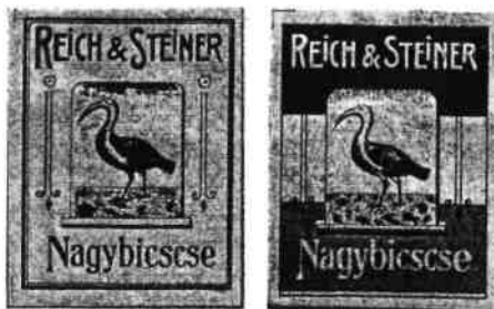
Nálepky na zápalkových škatulkách firmy Reich & Steiner

Prvé nálepky na škatulkách firmy Reich & Steiner obsahovali len priezviská majiteľov továrne a firemný znak v zobrazení vtáka ibisa. Pôvodne jednofarebný žltý podklad sa zmenil na pútavejší, trojfarebný (vodorovne vo farbách modrej, bielej a červenej).