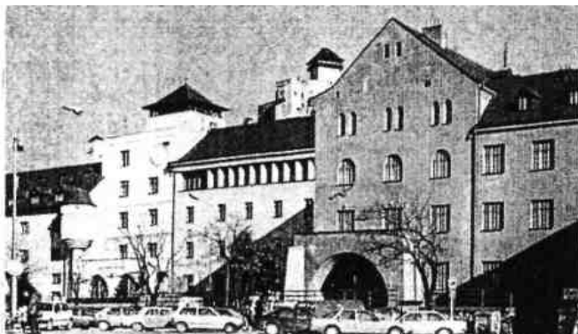
Časť budovy a vchod do Piaristického gymnázia J. Braneckého