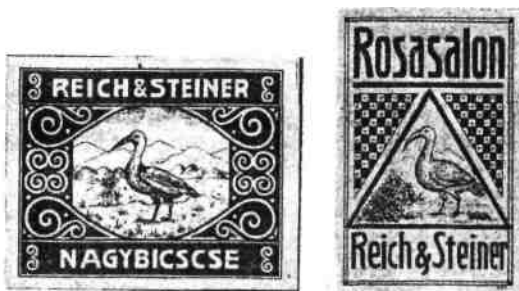
Zápalkové nálepky len v červenej farbe na bielom podklade

Koncom 19. storočia sa na reklamu viac začala využívať pútavejšia červená farba (čo praktizovali viaceré firmy v rôznych predajných a výrobných odvetviach). Uplatnenie našla aj vo firme Reich & Steiner. Možno len ako experiment pôsobí výnimočný text Rosa salon (Ružový salón) na nálepke červenej farby. Ďalšia nálepka taktiež v červenej farbe okrem ilustrácie vtáka ibisa v krajine, obsahovala na malom priestore bohatú secesnú ozdobu. Módny secesný štýl prenikal do architektúry, kultúry a v značnej miere sa využíval najmä v propagácii.